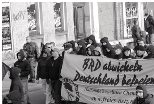
»Odstranit SRN – osvobodit Německo«: Transparent Nacionálních socialistů Chemnitz při demonstraci v lednu 2008 v Lipsku.

tlaku státních orgánů odolnější. Vedoucí osobnosti teď už zakázaných organizací jako Nacionalistická fronta (Nationalistische Front, NF), Německá alternativa (Deutsche Alternative, DA), Národní ofenziva (Nationale Offensive, NO) a některých dalších hledaly takové organizační modely, které by se ukázaly jako rezistentní vůči zákazům a také by garantovaly alespoň minimální míru funkčnosti.