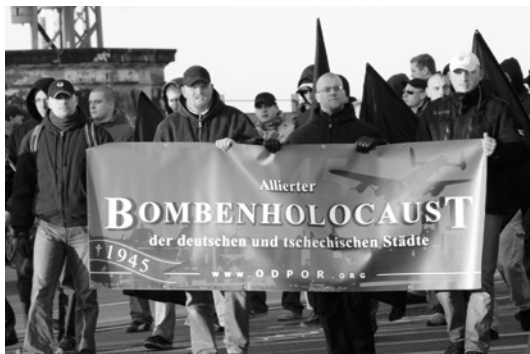
Čeští neonacisté 16. února 2008 v Drážďanech při tzv. Smutečním pochodu. Na transparentu je německy napsáno »Spojenecký bombový holocaust německých a českých měst«.

Každoročně se kolem 10. února v maďarském hlavním městě Budapešti koná mezinárodní vzpomínkové setkání neonacistů pod názvem »Den cti«, při kterém oslavují své historické vzory. Tradiční vzpomínková slavnost na počest padlých vojáků Waffen-SS se chápe jako pendant každoročního neonacistického únorového pochodu v Drážďanech u příležitosti bombardování v únoru 1945. 10. února 1945 podnikly maďarské vojenské oddíly spolu s jednotkami SS beznadějný únik z městské části Buda, která byla obklíčena sovětskou armádou; většina zúčastněných přišla o život nebo byla zajata.