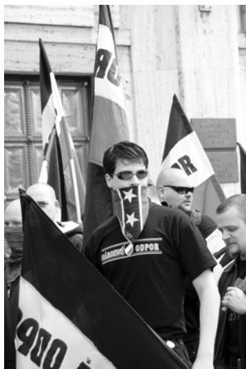
Demonstrace Národního odporu 1. května 2006 v Praze. Černo-bílo- červené vlajky patří k nezbytné výbavě.

Na rozdíl od ideologických střetů je vztah na subkulturní úrovni výrazně uvolněnější. V obou zemích se neonacistická scéna v posledních letech dále rozvíjela a stala se rozmanitější, s celou řadou nových trendů v módě i hudbě. Západosaští neonacisté z »NSHC« (national socialist hardcore) říkají: »Není důležité, jak vypadáš. Důležité je, že jsi NS.« Proto nepřekvapí, když v každodenním politickém životě převažuje pospolitost, zájem o společné zážitky, zábavu a politiku. K tomu se připojuje také určitý dobrodružný charakter aktivit překračujících hranice. Z jakého kulturního spektra mladí aktivisté pocházejí, je čím dál tím méně významné.