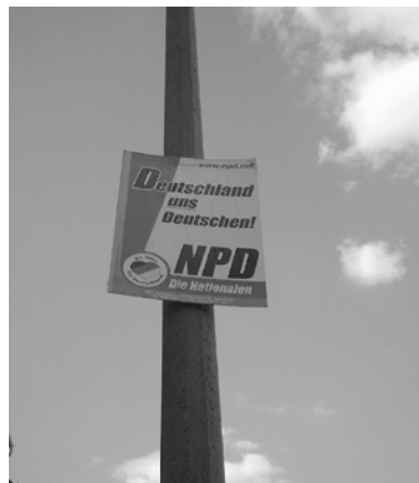
»Německo nám Němcům«: Volební plakát NPD v saské Pirně.

Volební úspěchy se však na počátku nedostavovaly. Aby to změnil, prezentoval Voigt v roce 1997 strategický koncept tří pilířů (viz schéma), se kterým už NPD dosáhla několika úspěchů. Od té doby se NPD sama vnímá jako strana-hnutí nacionálního a nacionálně socialistického spektra. Prezentuje pak sama sebe jak »revoluční hrot« »národního tábora«. Pro ještě větší zdůraznění byla vytvořena v roce 1998 akční jednotka pod názvem Nacionální mimoparlamentní opozice (NAPO).