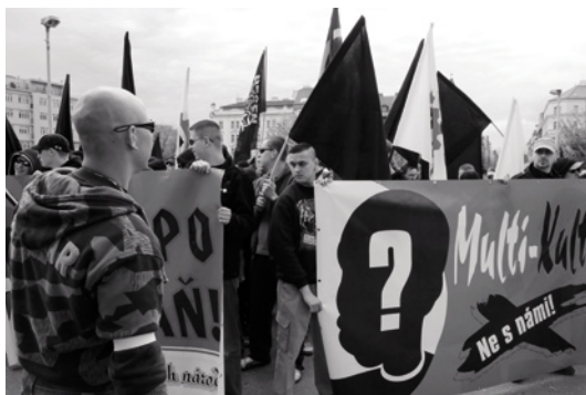
»Multi-Kulti? Ne s námi!«

Naproti tomu se pravicoví extremisté-neonacisté ( Národní odpor, Blood and Honour Division Bohemia, White Justice ) otevřeně prezentují jako nacionální socialisté, kteří se orientují na mezinárodní neonacistické hnutí, jehož hlavním pojítkem je idea nadřazenosti bílé rasy (white supremacy) a boj