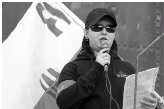
Aktivistka RWU na demonstraci 1. května 2008 v Praze.

své bílé muže a na své bílé děti ". Jejich největší a nejkrásnější povinností je „ uchovat kouzlo rodiny, jež je posvátná! ". Svaz žen odmítá feminismus, protože „ si žena začala vymýšlet, že její práva nejsou příliš velká a bezdůvodně se chtěla vyrovnat mužů. Začala nosit kalhoty a volit. Došlo to tak daleko, že najednou je tu dnešní doba a většina žen chce být rovna mužům. Z žen se stávají feministky. “ 125 Aktivistky se staví proti pornografii a potratům. V současné době jsou aktivní především prostřednictvím webových stránek.