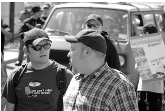
»We can't relax with Israel« neboli »Nemůžeme mít klid, když existuje Izrael«. Tričko s tímto nápisem nosí účastníci extrémně pravicové demonstrace v srpnu 2006 v Berlíně.

Stále oblíbenější je také pokus o převzetí levicové symboliky nebo toho, co je za ni považováno. Nošení »palestinských šátek« či černých vlajek je dnes na neonacistických akcích běžnou věcí. Symboly antifašistických uskupení a kampaní se vytrhují z navykých souvislostí a obracejí v protiklad. Dokonce i tzv. »čiro«, známý symbol punkové subkultury, už dnes není mezi neonacisty žádná tabu.