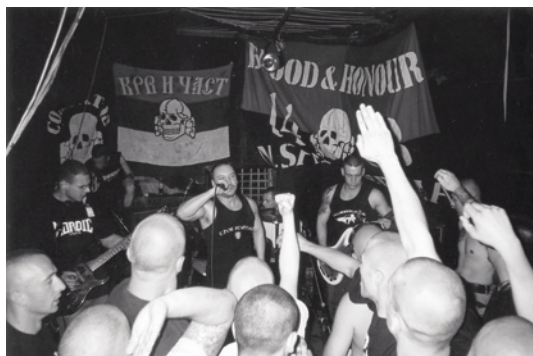
Skupina Conflict88 na koncertě v Srbsku.

landkult – Lass dich bloss nicht darauf ein. Englandkult, Englandkult, sei stolz darauf, Deutsch zu sein.“ (Kult Anglie – hlavně na to nepřistup. Kult Anglie, kult Anglie, bud' hrdý na to, že jsi Němec). Jen s malým zpožděním se v reálném socialismu v NDR vyvinula pravicová hudební scéna, i když podmínky pro její rozvinutí tam byly složitější. 117 Sice se organizovaly skupiny, které spolu chodily pít, lpěly na nacistické ideologii a dopouštěly se útoků na ty, které považovaly za »německé«. Chyběly ale hudební skupiny, možnosti vystupování a přístup ke zvukovým nahrávkám. Klasické Doc Martens musely být nahrazeny jednoduchými pracovními botami a Levi's Jeans napodobeninami. Německá scéna ale zažila boom poté, co se otevřely německo-německé hranice a radost ze znovusjednocení spolu s rasismem řízeným strachem před domnělým zaplavením země cizinci působily na náladu v zemi.