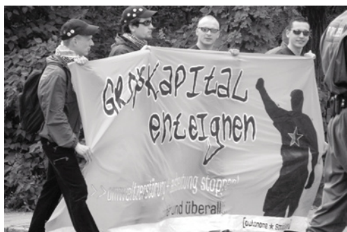
»Vyvlastnit velkokapitál« – transparent Autonomních socialistů při manifestaci v červenci 2005 ve Weisswasseru.