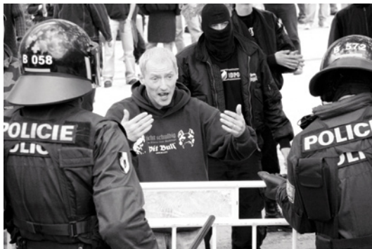
Demonstrace na 1. května 2006 v Praze.

Demonstrace jsou jedním z nástrojů, kterými se extrémní pravice s oblibou prezentuje na veřejnosti. Jsou využívány k oslovování veřejnosti a veřejnému deklarování politických názorů, posilování sounáležitosti aktivistů s idejemi hnutí, ale i k demonstraci „sily národního socialismu“. 144 Demonstrace jsou chápány jako předstupeň skutečného boje: „ Jedno ale vím jistě už teď. V pátek se bude demonstrovat. V sobotu se bude bilancovat. A jednou – jednou se bude účtovat! “ 145