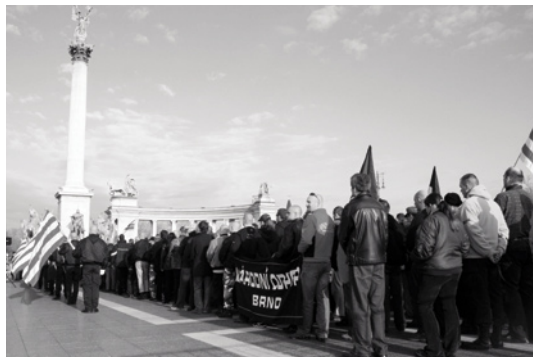
Čeští neonacisté z Národního odporu Brno 10. února 2007 při oslavě »Dne cti« v Budapešti.