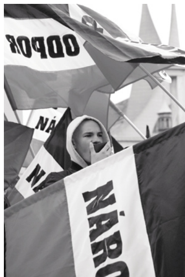
Demonstrace Národního odporu 1. května 2006 v Praze.

Sborník »Nebezpečné známosti. Pravicový extremismus v malém příhraničním styku« chce namísto krátkodobých projevů otřesení a instinktivních pokusů o přenesení odpovědnosti na druhé přispět k dlouhodobému vzdělávání a informování o pravicově extremistických strukturách, jejich aktérech a ideologických východiscích na obou stranách česko-německé hranice. Jedná se přitom o soubor textů, jejichž autoři a autorky patří na jedné straně mezi odborníky z nevládních organizací a na straně druhé působí jako poradci a pracovníci státních úřadů v oblasti boje s pravicovým extremismem a s ním spojenými násilnými a propagandistickými delikty. Tento sborník přináší analýzu současných přeshraničních kontaktů a aktivit pravicově extremistických uskupení.