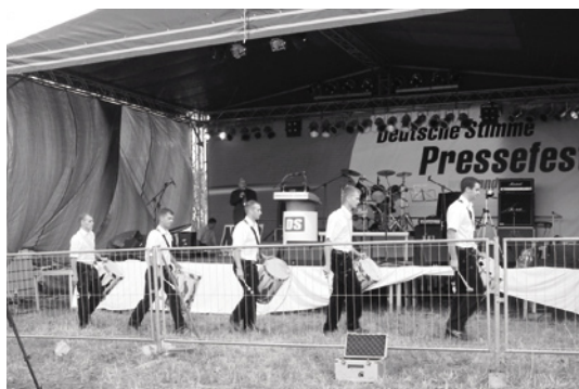
Pressefest nakladatelství Deutsche Stimme 5. srpna 2006 v Drážďanech-Pappritz.