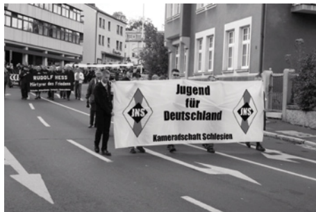
Kameradschaft Schlesien při manifestaci pro Rudolfa Hesse v roce 2004 v bavorském Wunsiedelu.

Vytváření sítí mezi jednotlivými uskupeními neprobíhalo pouze v rámci subkulturní extrémní pravice. Od poloviny 90. let se extrémně pravicoví aktéři nejrůznějších směrů spojovali a vystupovali na veřejných akcích. Jako příklad může sloužit pravidelně pořádaný pochod v bavorském Wunsiedelu na počest úmrtí Rudolfa Hesse nebo vzpomínkový pochod u příležitosti výročí leteckých útoků na Drážďany z 13. února 1945, které je zneužíváno k revizionistické propagandě. Těchto demonstrací se účastní tisíce členů pravicově extremistických stran a přívrženci neonacistického spektra a »svobodných kamaráďšaftů«.