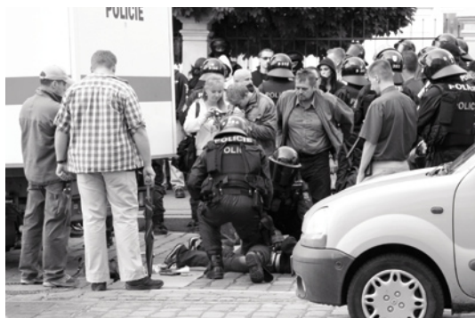
Zásah české policie při extrémně pravicové demonstraci v Praze.

V České republice platí zákony, které umožňují relativně efektivní trestní postih pravicového extremismu. Na druhou stranu však existují i nejasnosti ohledně uplatňování těchto norem. K tomu přispívají jak jednotlivá rozhodnutí Nejvyššího soudu, tak neznalost těchto rozhodnutí na straně nižších úrovní policie, státních zastupitelství a soudů.