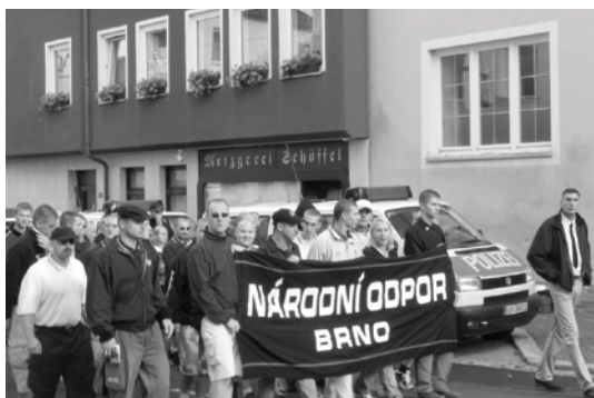
Členové Národního odporu z Brna při pochodu za Rudolfa Hesse v roce 2004 ve Wunsiedelu.

zástupců mnoha dalších zemí mohou mít úvodní slovo. Rieger to totiž okamžitě zamítl. Bez omluvy za Benešovy dekrety tam prý nevystoupí žádný český řečník: